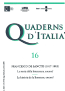
FRANCESCO DE SANCTIS (1817-1883) La storia della letteratura, ancora! La Lettera de la Biblioteca, ancora!

Dedichiamo il dossier monografico del presente numero ad una riflessione sulla Storia della Letteratura Italiana di Francesco de Sanctis pubblicata negli anni 1870-1871, non solo come anticipazione del futuro secondo centenario del-